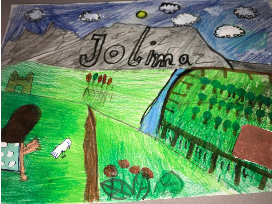
Emilia Bräunling (5b)