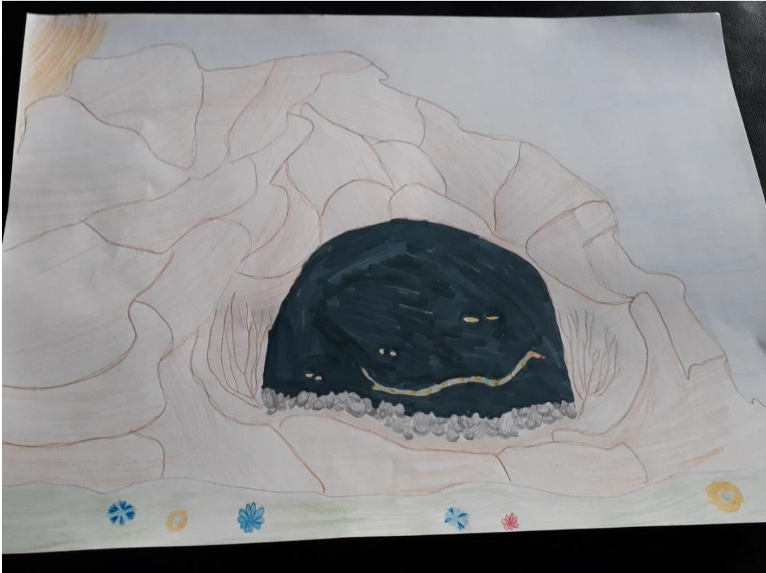
Malte Breunig (5c)