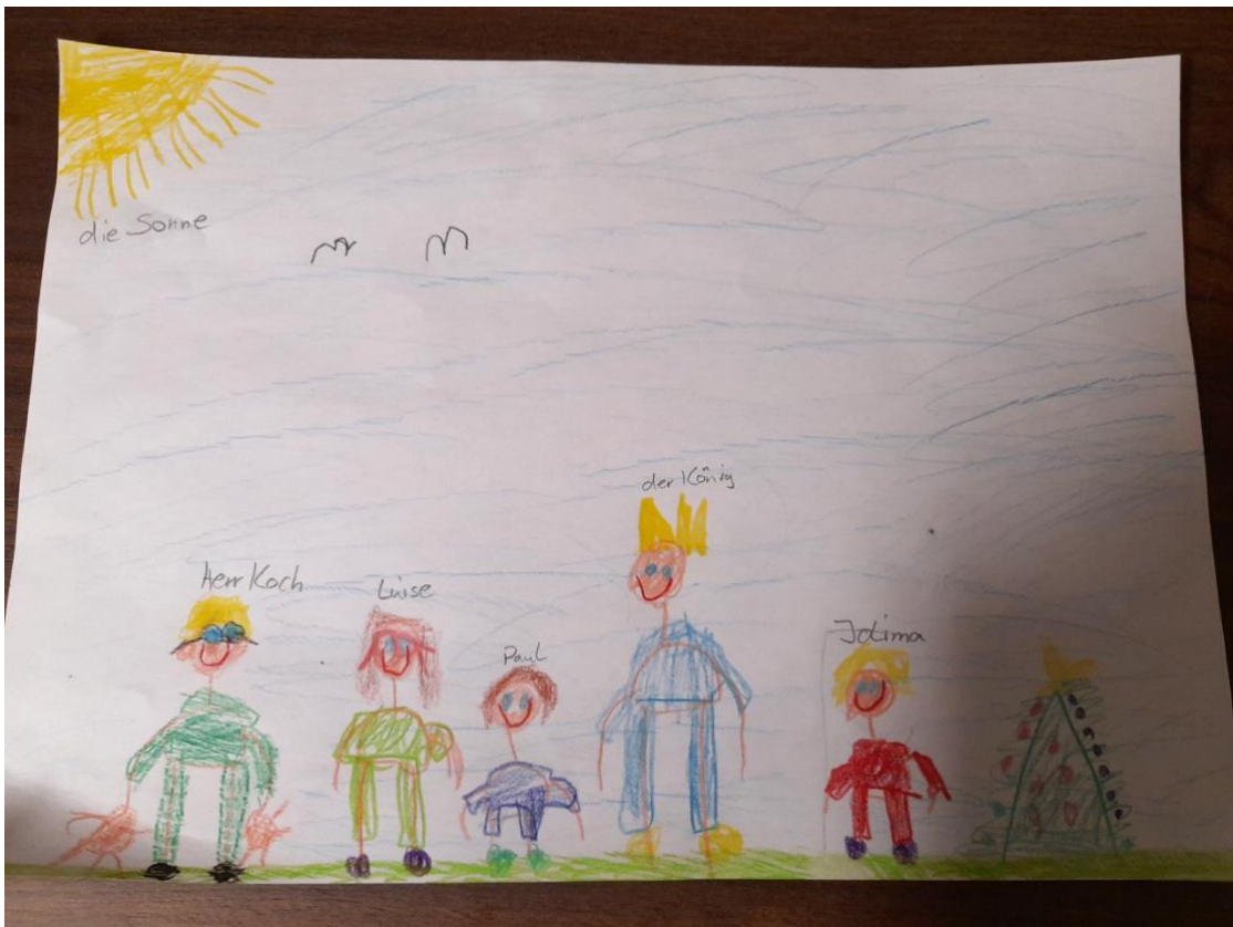
Salomes kleine Schwester Neele (6J)